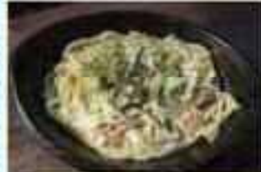
クリームパスタ 600円

冬季数量限定★ 牧場育ちのサツマイモを じっくり1時間掛けて焼いた お芋🍠はこの冬おすすめ☆