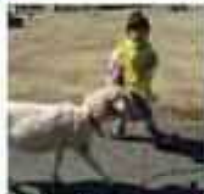
ひっしのお散歩体験