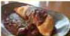
まきほのオムライス 1,000円