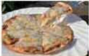
自家製ミートソースピザ 1,000円