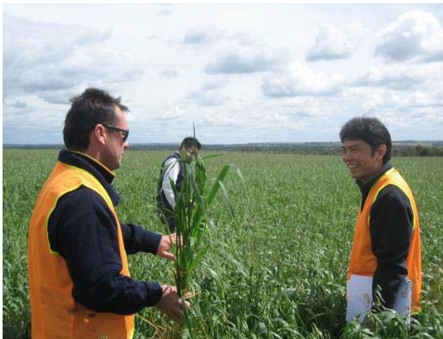
西豪州産オーツハイ圃場（9/29撮影） あと10日ほどで刈取り予定

9月に入り降雨も適度にありましたが、気温はあまり上がらず当初予定よりも1週間遅れの10月初旬から刈取りが開始される見込みです。雨を待たずに播種をした圃場の生育は比較的順調と言え、6トン/ha以上の単収が見込まれています。一方南部地区では未だに生育途中で、刈取りには2-3週間を要する見込みです。